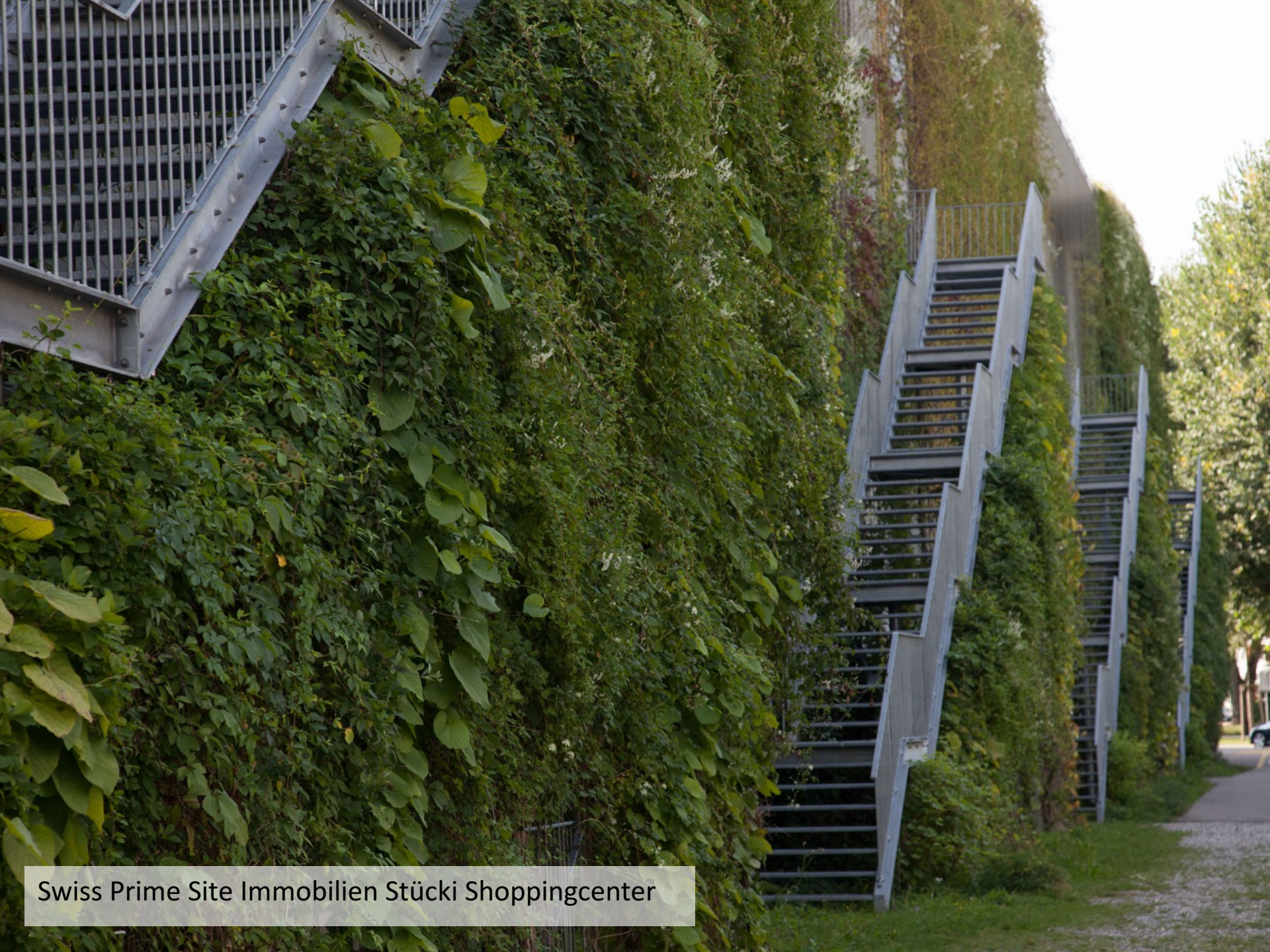
Swiss Prime Site Immobilien Stücki Shoppingcenter