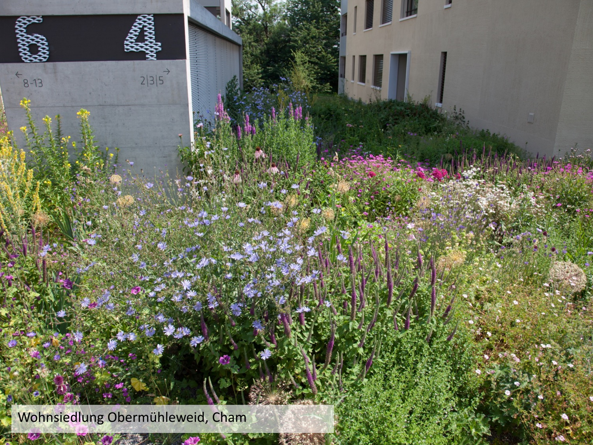
Wohnsiedlung Obermühleweid, Cham