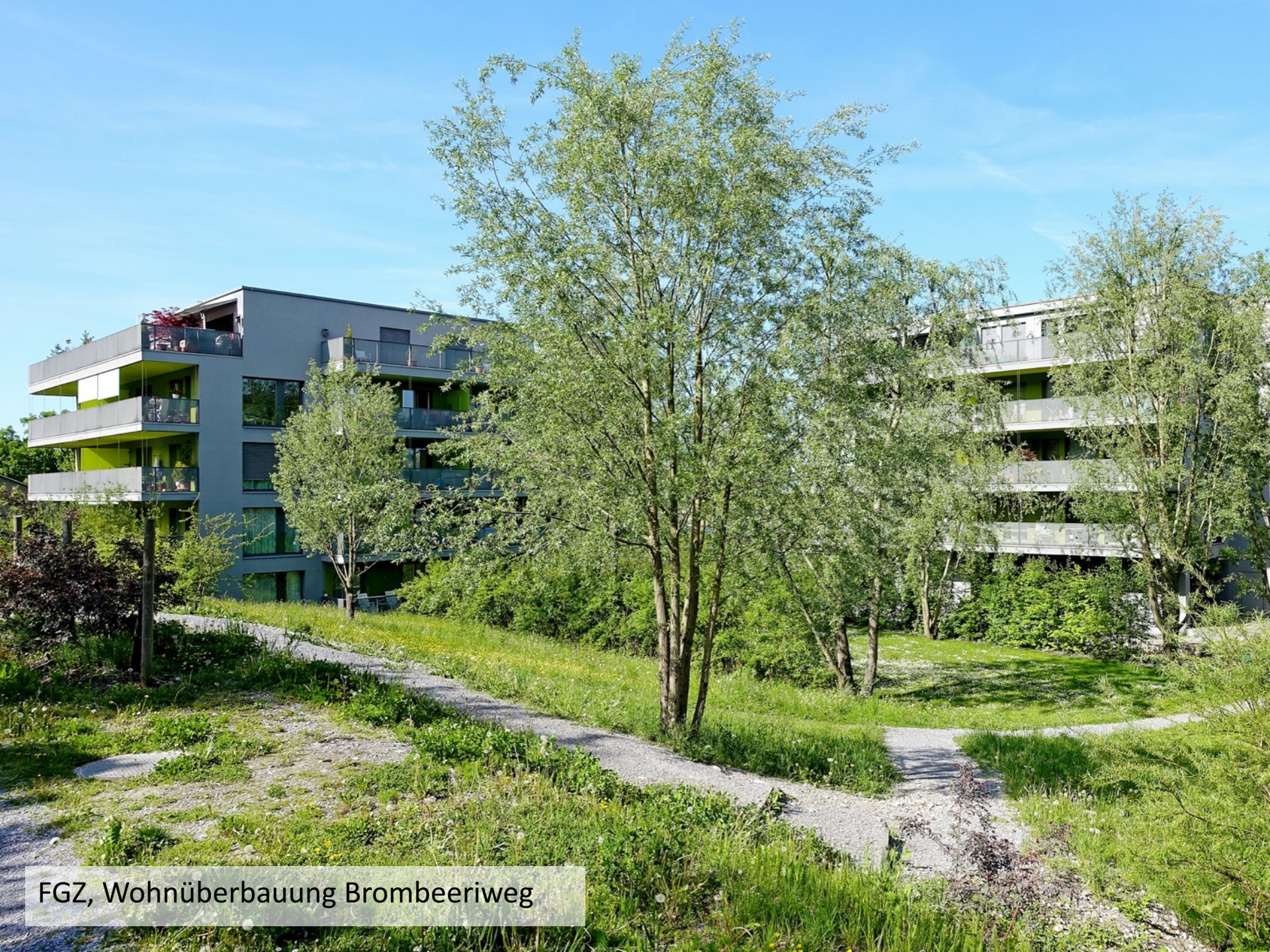
FGZ, Wohnüberbauung Brombeeriweg