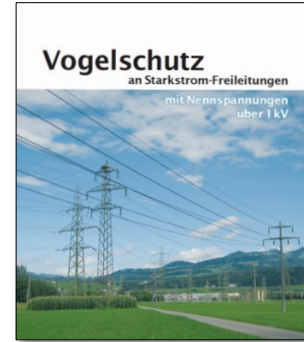
(VSE, BAFU, ESTI, SVS, Vogelwarte)