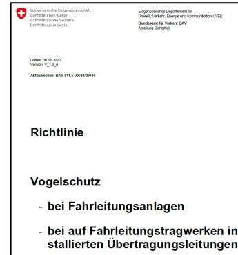
(BAV, BAFU, SBB, RhB, RBS, Vogelwarte)