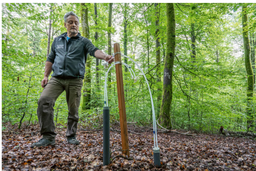
Versuchsaufbau in Bachs: die Möglichkeit einer Sanierung von tiefgründig versauerten Waldböden mittels Kalkung testen