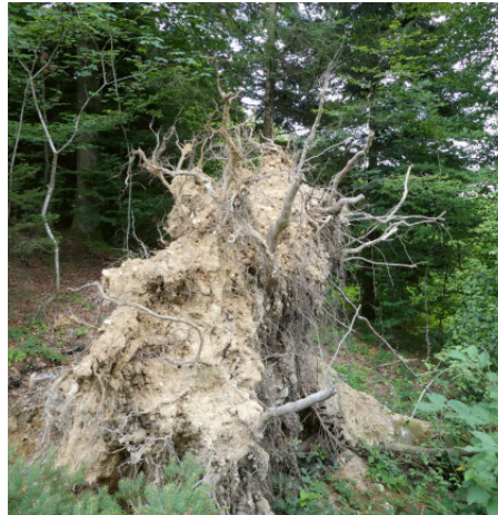
Windwurf einer Buche mit geschädigtem Wurzelwerk

Eine Kalkung kann jedoch nicht Massnahmen zur Reduktion der Emissionen an der Quelle ersetzen. Diese sind nach wie vor dringlich. Diese Schwierigkeiten sieht auch Steiner: «Da wir mit Naturverjüngung schaffen, ist es für uns immens wichtig, dass