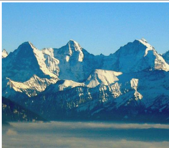
IFP 1507/1706 Berner Hochalpen und Aletsch-Bietschhorn-Gebiet