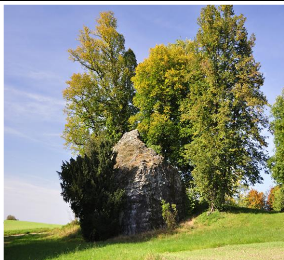
IFP 1419 Pfluegstein ob Herrliberg