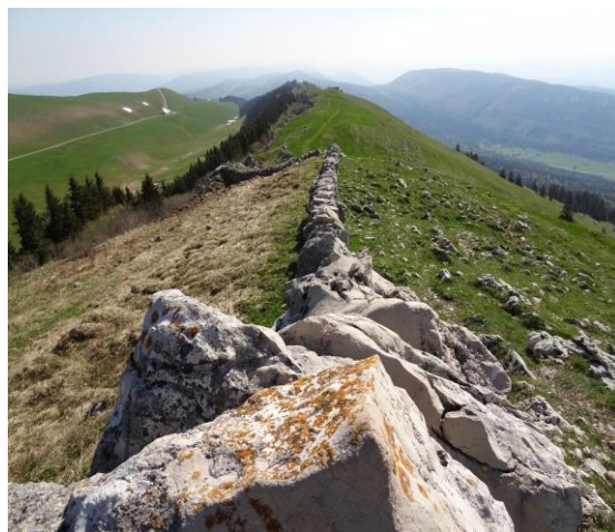
IFP 1002 Chasseral (Jura plissé)