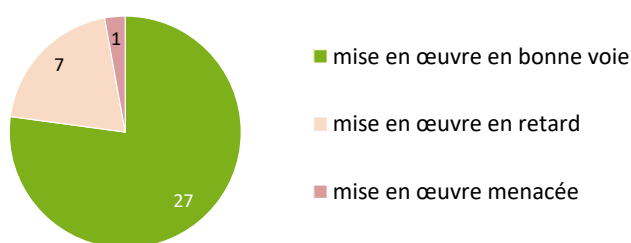
Figure 3 : État de mise en œuvre des mesures de la CPS

L'auto-évaluation de la mise en œuvre des mesures est tout aussi positive (cf. fig. 3). La mise en œuvre n'est menacée que pour une seule mesure, et elle a pris du retard pour sept autres.