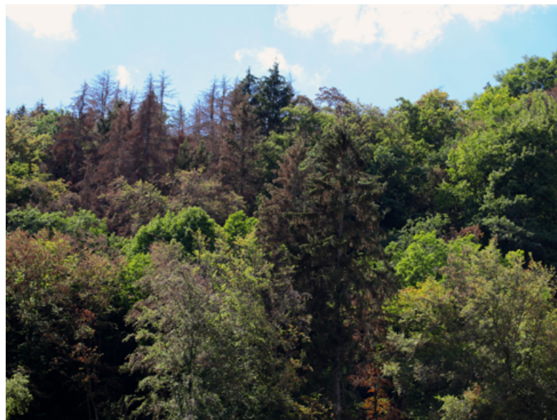
Dans cette forêt mélangée, l'épicéa et le hêtre ont beaucoup souffert à cause de la sécheresse. Les chênes sont en bonne santé.

La question de savoir si des générations d'arbres croissent dans les forêts suisses, et si oui, de quel type, revient à étudier la capacité de régénération des forêts et les mesures de soins aux jeunes peuplements, qui peuvent être adaptées au cas par cas en fonction des objectifs de gestion ou de facteurs environnementaux (p. ex. climat). Selon les résultats de l'IFN4, la capacité de régénération des forêts varie d'une région à l'autre : en plaine, les peuplements font l'objet d'une gestion qui permet activement leur régénération et la diversité des essences augmente, tandis qu'en altitude, les peuplements qui ne sont plus gérés depuis des décennies sont en hausse. Ils deviennent alors de plus en plus denses et ne parviennent plus à se régénérer correctement. La Confédération, les cantons, les associations et d'autres organisations doivent disposer de moyens adéquats pour inciter les propriétaires forestiers à prendre activement